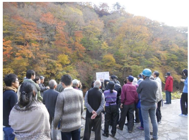
現地ガイドの様子