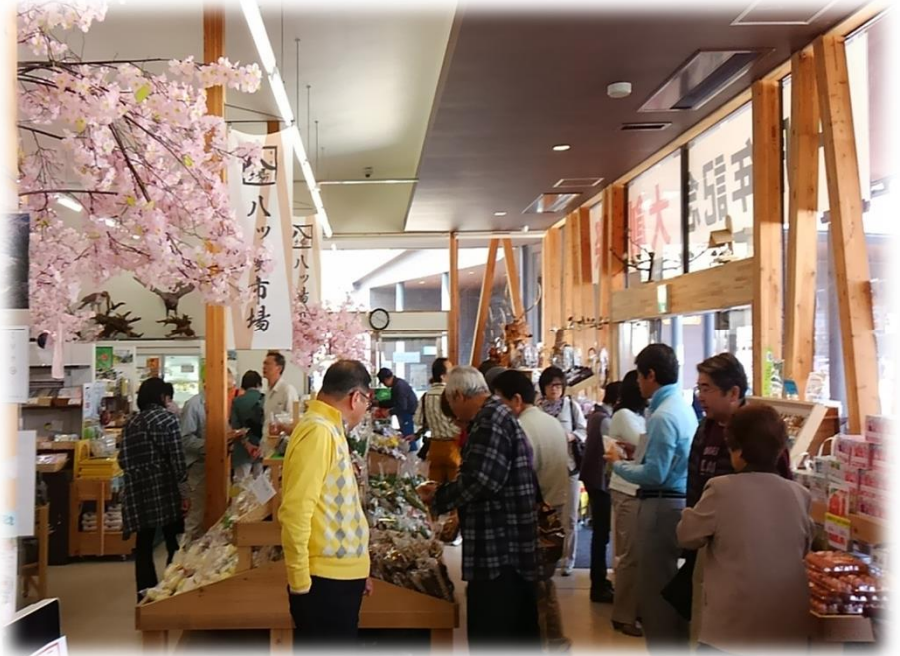
道の駅ハッ場ふるさと館