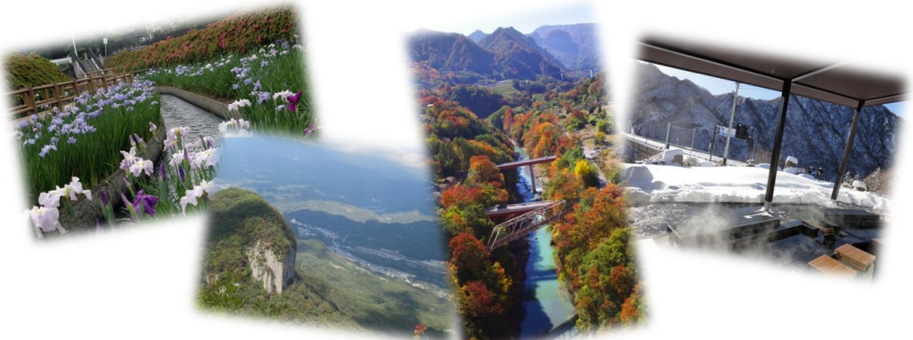
四季の風景(イメージ)