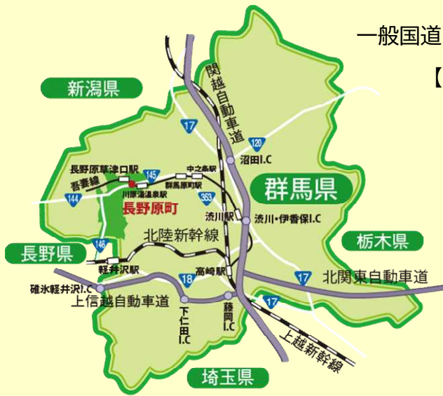
(道の駅ハッ場ふるさと館HP)